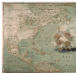
Carte de l'Amérique par l'Abbé Bernou, 1681 BNF. Département des Cartes et plans Réa. SH Port 122, div. p. bco 0